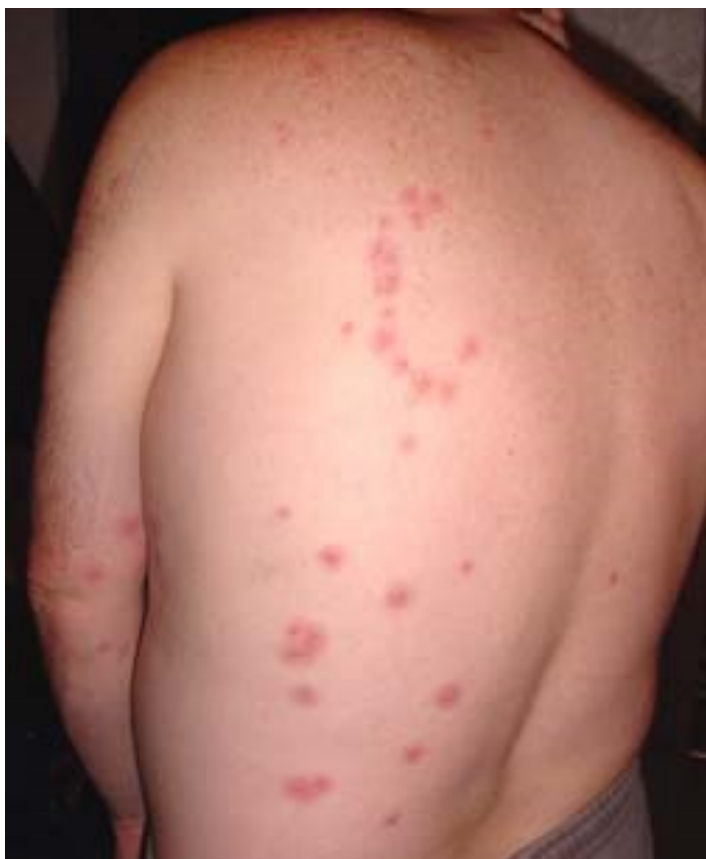
Obr. 3: Projevy na kůži po poštípání štěnicí [5]