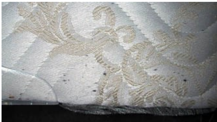
Obr. 2: Výskyt štěnice na matraci [5]